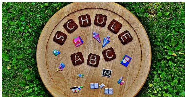
Ganztagsangebote Profil 3

Die Hausaufgabenbetreuung kann weder Nachhilfe noch Einzelförderung in großem Umfang sein. Die Kinder erhalten jedoch in jedem Fall Unterstützung. Die Ganztagskräfte stehen diesbezüglich in engem Kontakt mit den Klassenlehrkräften.